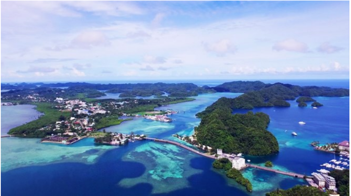
Quê hương Palau xinh đẹp giàu lên nhờ du lịch.

Nằm phía tây Thái Bình Dương, Cộng hòa Palau bao gồm nhiều hòn đảo và có hệ sinh thái đa dạng từ các đảo san hô như Kayangel tới quần đảo Rock vì cấu tạo hoàn toàn bằng đá vôi hay hẻm núi đá vôi. Giống như nhiều quốc gia khác Thái Bình Dương, Palau đã vào du lịch như một ngành kinh tế chính của nền kinh tế. Khi số du khách tiếp tục tăng, các vấn đề bắt đầu phát sinh, nhiều du khách và người dân không còn tôn trọng hệ sinh thái và thiên nhiên, nhưng thay vì “đóng cửa” du lịch bảo tồn môi trường, họ quyết định làm một cuộc cách mạng “cởi trói” và lan tỏa ý thức bảo vệ môi trường nơi người dân bản địa và du khách.