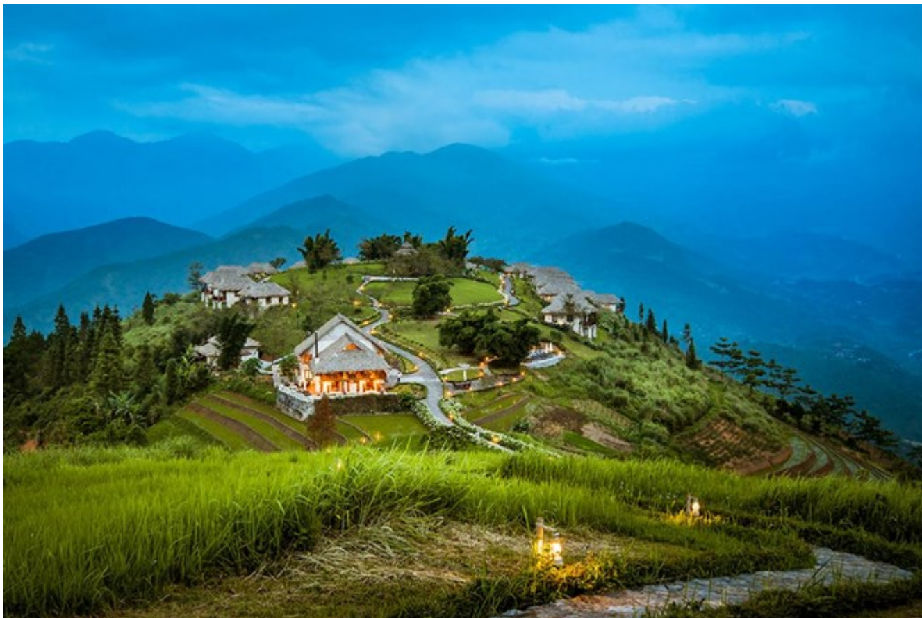
Toàn cảnh Resort Topas Ecolodge Sapa.

Nhiều giải thưởng, tạp chí du lịch uy tín thế giới cũng xếp tên Việt Nam các hãng mục thân thiện với môi trường như: Tạp chí National Geographic công nhận Resort Topas Ecolodge (Sa Pa, Lào Cai) là một trong 10 khu resort xanh nhất thế giới - nơi nghỉ dưỡng tuyệt vời dành cho các du khách yêu môi trường (năm 2017) ; Trips to Discover - website review kinh nghiệm du lịch với hơn 14 triệu thành viên đã chọn là Six Senses (Côn Đảo) nằm trong top 11 khu nghỉ dưỡng thân thiện với môi trường nhất thế giới; gần đây nhất InterContinental Danang Sun Peninsula Resort cũng Giải thưởng Du lịch Thế giới (WTA) Châu Á - Châu Đại Dương vinh danh là "Khu nghỉ dưỡng thân thiện với môi trường nhất châu Á...."