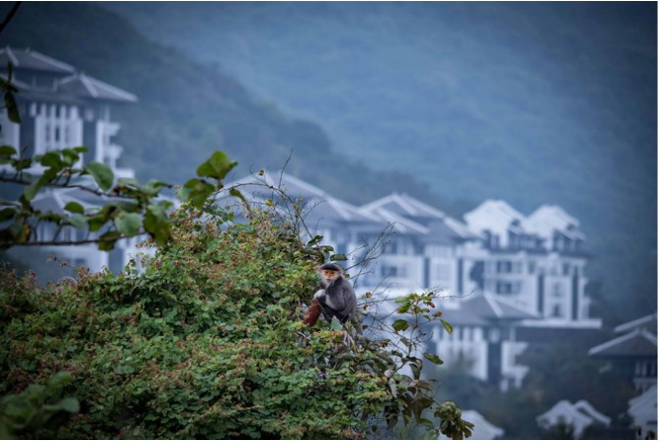
Voc InterCon Danang Sun Peninsula Resort.

Nhng nm gn ây, du lch Vit Nam bt u khi sc. Nm 2018, du lch Vit Nam ã ón 15,5 triu lt khách quc t, phc v 80 triu lt khách ni a. Trong 8 tháng u nm 2019, du lch Vit Nam ã ón 11,3 triu lt khách, tng 8,7% so vi cùng k nm 2018 và tng thu t khách du lch tng 9,6% so vi cùng k nm 2018. “Du lch xanh - sch - p và vn minh” là n tng ca nhieu du khách khi thm nhieu im n mi ca Vit Nam thi gian gn ây.