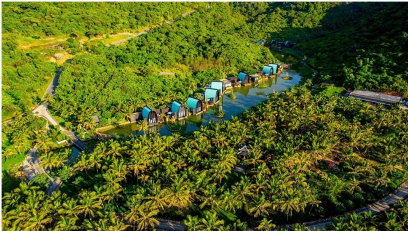
InterCon Danang Sun Peninsula Resort.

Du lịch xanh Việt Nam cần có những bài bản