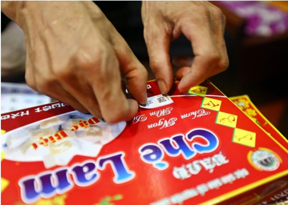
Dán tem VNPT Check cho sản phẩm chè lam Thạch Xá.

Để hỗ trợ người tiêu dùng và doanh nghiệp trước “con bão” hàng giả, hàng kém chất lượng gây ảnh hưởng rất lớn đến lợi nhuận của những doanh nghiệp sản xuất, kinh doanh chân chính và ảnh hưởng trực tiếp đến quyền lợi, sức khỏe của người tiêu dùng, Tập đoàn Bưu chính Viễn thông Việt Nam (VNPT) đã nghiên cứu và phát triển thành công giải pháp xác thực nguồn gốc hàng hóa VNPT Check.